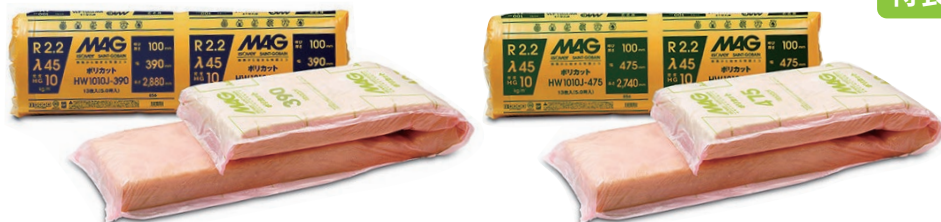
390mm 幅 (印刷色: 青)