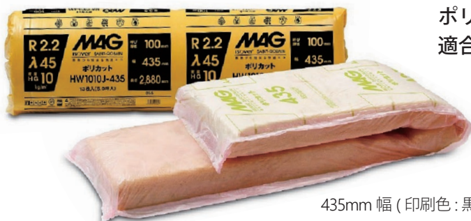
435mm 幅 (印刷色: 黒)

ポリカット 10K 100mm を簡単・手軽に省エネ基準に適合できるようグレードアップいたしました。