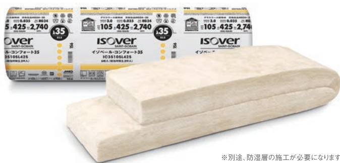
※別途、防湿層の施工が必要になります